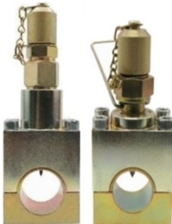
(links serv-Clip Typ 1- für auch Montage unter Druck) (rechts serv-Clip Typ 2 – für Drucklose Montage) (Montage: 3 Minuten)