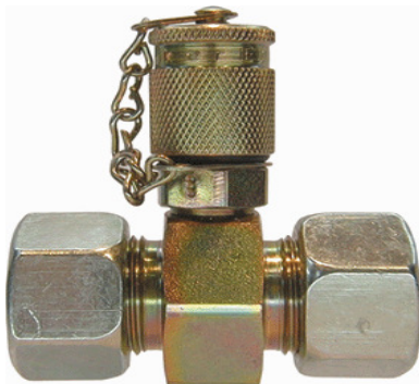
Konventionelle gerade Verschraubung mit Messanschluss (min. 1 Std. Montage).

SERV-CLIP® der Rohrmessanschluss bis 630bar